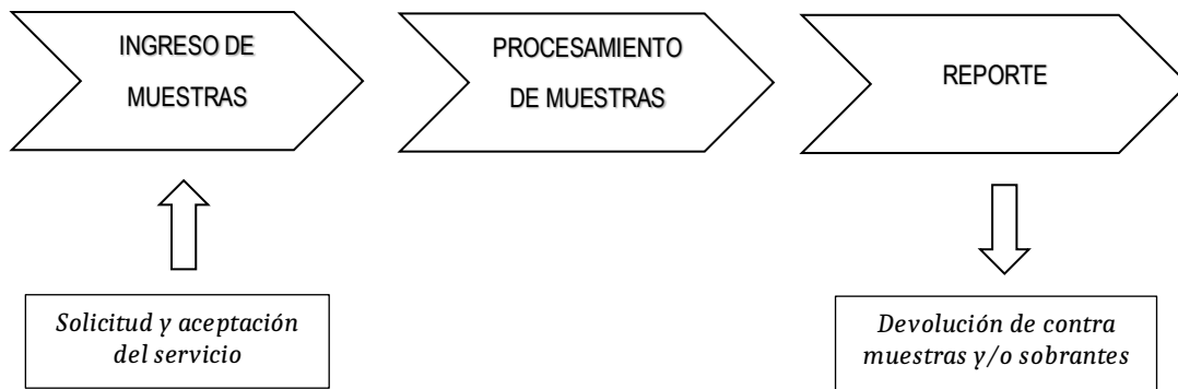
Figura 1. Diagrama de flujo para el procesamiento de muestras