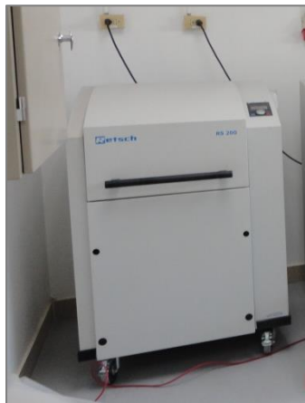
Figura 5. Equipo de Pulverización