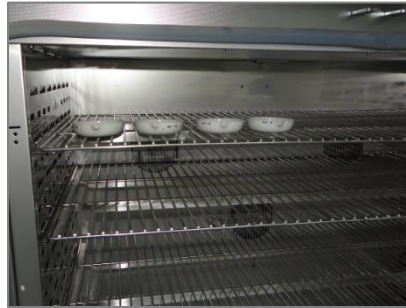
Figura 2. Secado