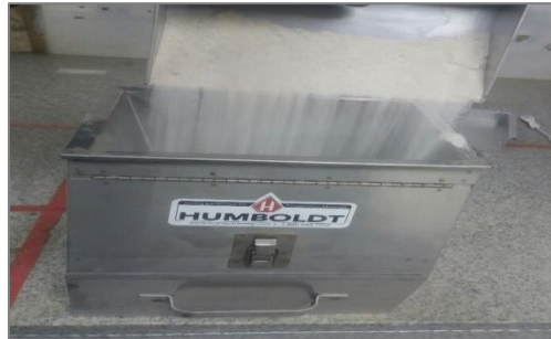
Figura 4. Homogenización y cuarteo