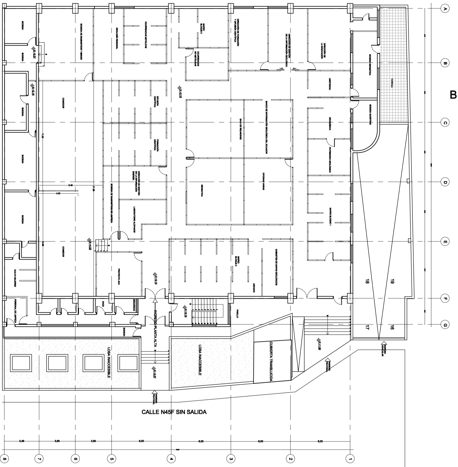
ESTADO ACTUAL PLANTA ALTA E93C — 1:100